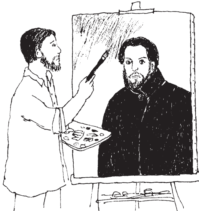
«تصویر خودش با شئل»، سال ۱۹۰۱

پیکاسو اثر گذاشت. او دو منظره‌ی تیره و تاریک از مراسم خاک‌سپاری و دو تصویر از جسد کارل کشید. سپس نقاشی با رنگ آبی را شروع کرد. پابلو گفت، «فکر کردن به کارل موجب شد که من نقاشی با رنگ آبی را شروع کنم.» او در سال ۱۹۰۱ تصویری از خودش کشید که بیش‌تر آن به رنگ آبی بود. این نقاشی او را بسیار غمگین می‌کرد. این زمان بعدها به دوران آبی‌فام پیکاسو معروف شد.